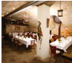
Hotel „Lamm“, Hebsack.