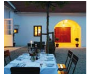
„Gut Purbach“, Purbach.

am Westufer des Sees sind die todschicke «Mole West» ( www.mole-west.at ) direkt am Seeufer im Neusiedler Strandbad oder die schön gelegene «Seejungfrau» ( www.seejungfrau.at ) im Jachthafen in Jois. Für das süsse Herz sind dort die Nougatknödel recht empfehlenswert. In Purbach hat sich das «Gut Purbach» als kulinarischer Hotspot etabliert ( www.gut-purbach.at ). In und um Rust sind das feine Restaurant «Inamera» ( www.inamera.at ) oder, etwas entspannter, doch genauso hochklassig, das Wirtshaus im «Hofgassl» ( www.hofgassl.at ) empfehlenswert. Ein Buschenschank in moderner Interpretation ist das «Gut Oggau» ( www.gut-oggau.com ). Edel übernachten kann man in «Mooslechners Bürgerhaus» ( www.hotelbuergerhaus-rust.at ).