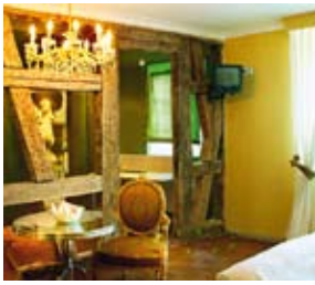
Hotel „Schiller“, Bietigheim.